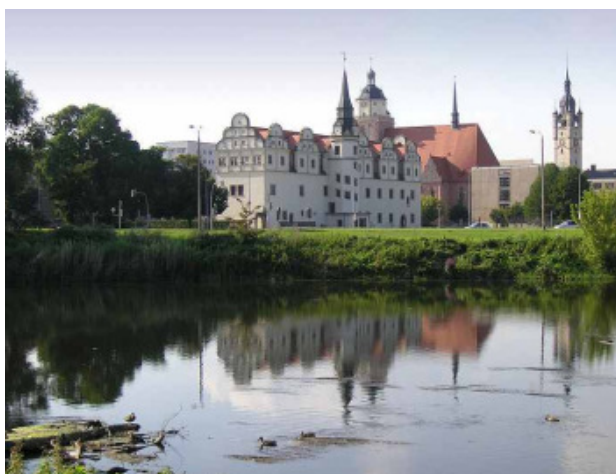
Dessau vidata de la rivero Mulde

Me invitas vi deskovror la bela regiono Sachsen-Anhalt en Germanio. De la 23-ma til la 29-ma dil julio 2012 eventoj en Dessau, Germanio, cent kilometri sude de Berlino, la Internacia Ido-renkontro 2012. Dum la antea semanofino 21-ma til la 23-ma dil julio 2012 eventoj prerenkontro en Berlino, ĉefa urbo de Germanio, e Potsdam, ĉefa urbo de Brandenburgio. Ĉi prerenkontro estas organizita de nia lokala grupo - la Ido-Amiki-Berlin.